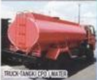
TRUCK TANKER CPO / WATER