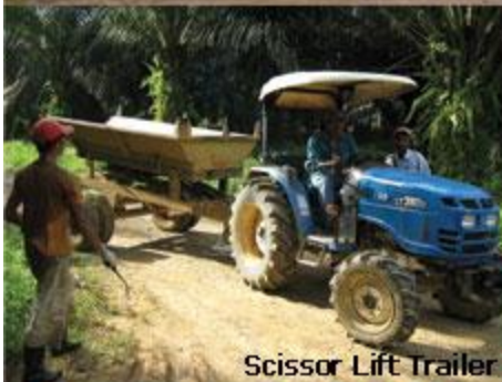
Scissor Lift Trailer