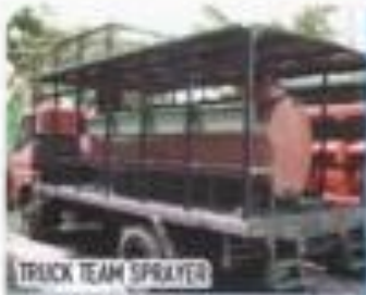
TRUCK TEAM SPRAYER