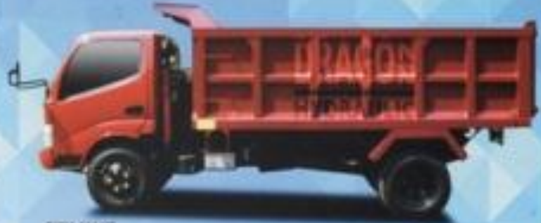
DYNA 130 HT

PT. PEMUDA BAJA RAYA SPECIAL PURPOSE VEHICLE MANUFACTURER SPECIALIST DUMP TRUCK & TRAILER