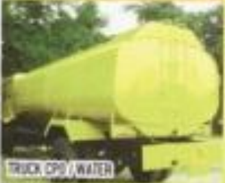
TRUCK CPO / WATER