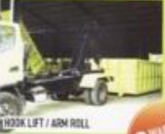
HOOK LIFT / ARM ROLL