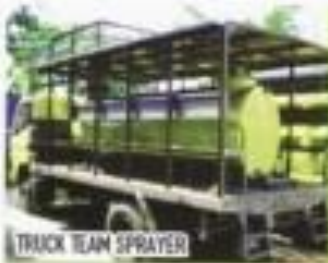
TRUCK TEAM SPRAYER