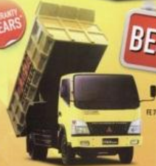
FE 74 / FE 75