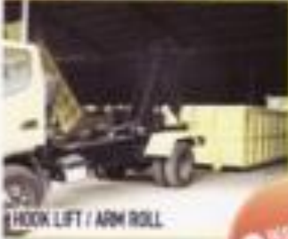
HOOK LIFT / ARM ROLL