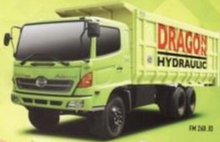
FM 268 JJ