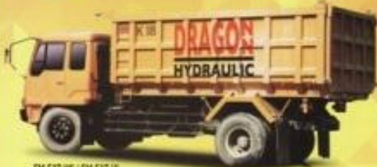
FM 517 NS / FM 517 HL

PT. PEMUDA BAJA RAYA SPECIAL PURPOSE VEHICLE MANUFACTURER SPECIALIST DUMP TRUCK & TRAILER