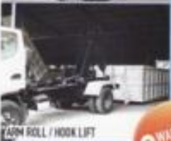
ARM ROLL / HOOK LIFT