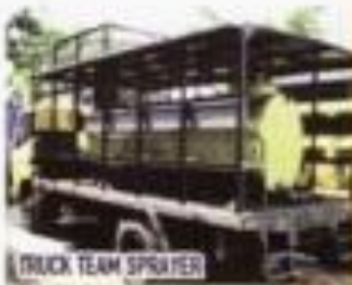
TRUCK TEAM SPRAYER