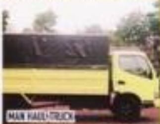
MAN HAUL TRUCK