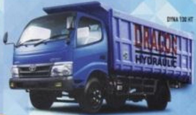
DYNA 130 HT