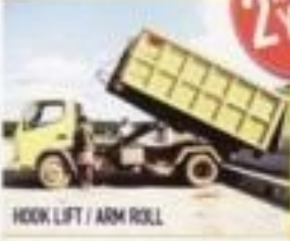
HOOK LIFT / ARM ROLL