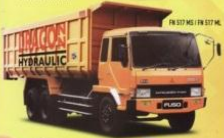
FM 517 MS / FM 517 ML