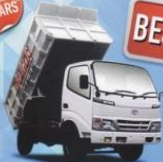
DYNA 130 HT