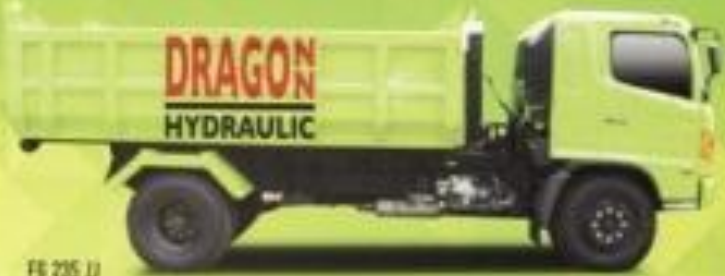
FB 235 JJ

PT. PEMUDA BAJA RAYA SPECIAL PURPOSE VEHICLE MANUFACTURER SPECIALIST DUMP TRUCK & TRAILER