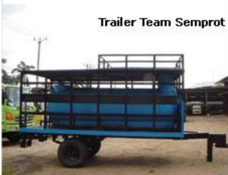
Trailer Team Semprot

Office : Rukan Taman Meruya Blok M no.33 Jakarta Barat 11620, Indonesia Plant : Jalan Raya Serang Km.30 Desa Cangkudu Balara