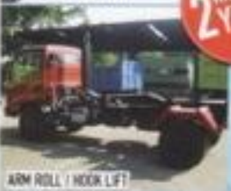
ARM ROLL / HOOK LIFT