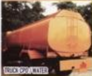
TRUCK CPO / WATER