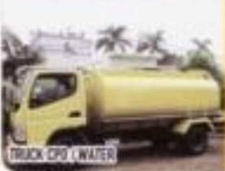
TRUCK CPO / WATER