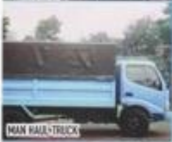
MAN HAUL TRUCK