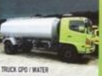
TRUCK CPO / WATER